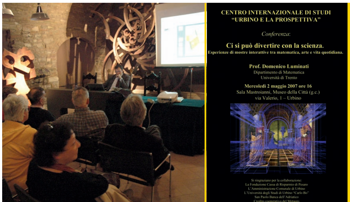
A sinistra: foto scattata al seminario. A destra: locandina del seminario

arte, nello spirito dell'umanesimo matematico che aveva caratterizzato l'ambiente scientifico e tecnico-artistico del ducato di Urbino nel Rinascimento. Mimmo fu entusiasta dell'idea, la possibilità di venire a Urbino nelle vesti di conferenziere lo rese addirittura euforico e nel giro di poche ore mi inviò una proposta di titolo e un'immagine per la locandina che volevamo fosse in qualche modo legata all'idea di prospettiva (idea da cui prende il nome l'associazione, in quanto proprio a Urbino sono stati scritti i primi trattati rigorosi sulla prospettiva, il De prospectiva pingendi di Piero della Francesca e De prospectiva libri sex di Guidobaldo del Monte). La data fissata per la conferenza era il 2 maggio 2007 (come si vede nella locandina in figura) e il luogo la Sala Mastroianni, situata all'interno del Museo della Città di Palazzo Odasi, che nessuno di noi conosceva perché non era stata ancora inaugurata. Si tratta di una sala per conferenze in cui sono collocate in modo permanente delle enormi sculture lignee dell'artista Umberto Mastroianni (visibili sullo sfondo della foto in figura, scattata durante la conferenza). Insomma questa sala, ora molto utilizzata, fu ufficiosamente inaugurata "in anteprima" da Mimmo con la conferenza dal titolo "Ci si può divertire con la scienza. Esperienze di mostre interattive tra matematica, arte e vita quotidiana".